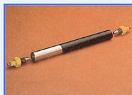
Hochstabile Lagerung der Schwenkeinheit